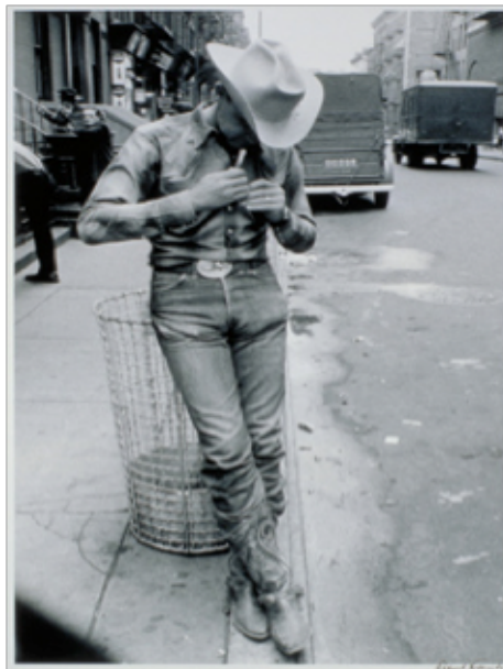
Robert Frank New York City, 1954 © Robert Frank, from The Americans

Les expositions du 20 janvier au 22 mars 2009