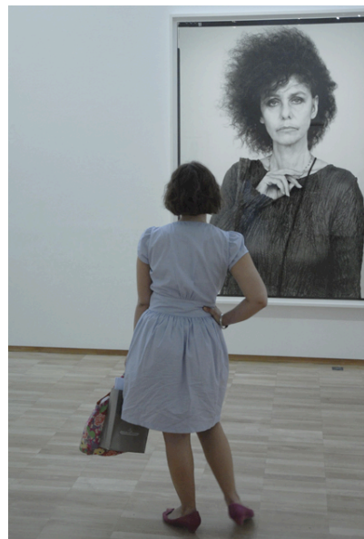
Vue de l'exposition « Richard Avedon », photographies 1946 – 2004, au Jeu de Paume.

De mardi en mardi, ce public est ainsi invité à découvrir les œuvres de photographes reconnus, de vidéastes contemporains et d'artistes émergents dans le cadre de la Programmation Satellite. Il a également accès gratuitement aux différents cycles de la programmation cinéma.