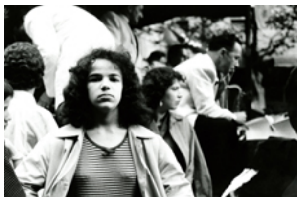
Robert Frank Paris, 1949 - 1952

Au sein de l'exposition, seront présentés le premier film de Robert Frank, Pull My Daisy (1959) et son dernier film True Story (2004). La majeure partie de ses films sera également programmée à l'auditorium pendant toute la durée de l'exposition.